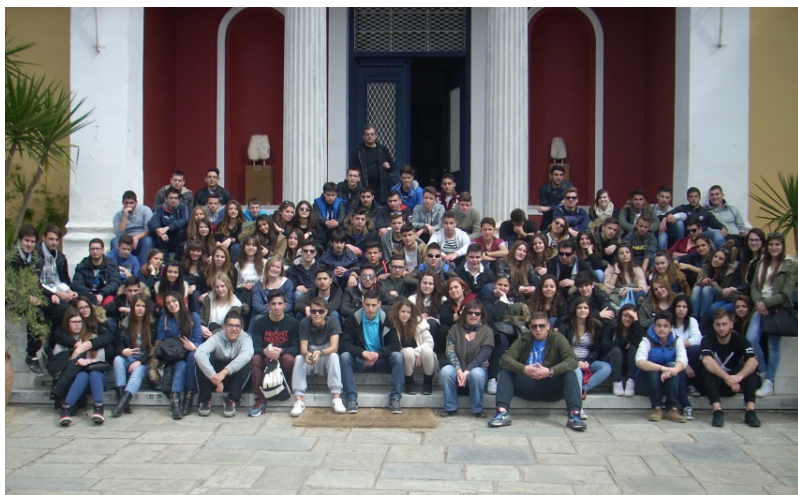
Από την τριήμερη εκδρομή στο Βόλο της Α' και Β' Τάξης

Όλοι οι συνοδοί-καθηγητές είχαν την αγωνία αυτή: Μήπως τις τρεις ημέρες της εκδρομής ανοίξει ο ασκός του Αιόλου και περάσουν από σαράντα κύματα.