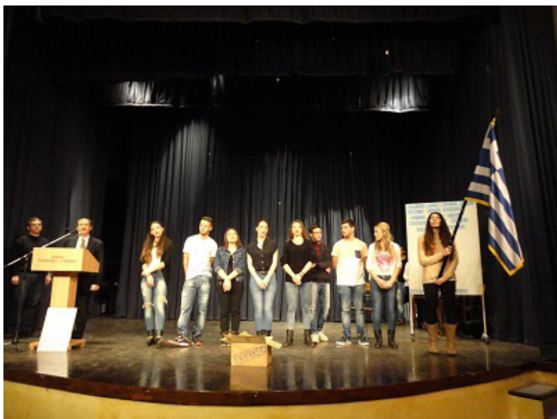
Εκδήλωση της 25 ης Μαρτίου

Όχι μόνο με χειροκρότημα ξεκίνησε αλλά και τελείωσε η γιορτή της 25ης Μαρτίου που παρουσιάστηκε από τους μαθητές του Β1 με υπεύθυνο τον κ. Βογιατζή Γρηγόρη. Οι μαθητές ετοίμαζαν για ημέρες τα ποιήματα, τους λόγους και τους ρόλους τους με σκοπό την παρουσίαση μίας επιτυχημένης γιορτής. Μετά από πολλές πρόβες εντός αλλά και εκτός σχολείου τα παιδιά του Β1 καταπολέμησαν το άγχος που τους είχε γεμίσει και παρουσίασαν μία αξιοπρεπέστατη γιορτή. Φυσικά, η προσπάθεια τους ανταμειφθηκε με τον καλύτερο δυνατό τρόπο-θερμά χειροκροτήματα και θετικά σχόλια απ' όλους όσοι παρευρέθηκαν και παρακολούθησαν την γιορτή.